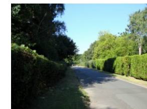
Hauts de Grisy

Continuer toujours par la gauche jusqu'à ressortir sur la route de Villepreux à Renne-moulin. Aller jusqu'au rond-point (D 161 - D 12) et poursuivre en face vers Renne-moulin. Après 100 m, prendre le chemin qui monte en biais sur la gauche (direction NE). Arrivé à un pigeonnier, prendre la route derrière la barrière en bois, puis au croisement suivre à droite le chemin des Hauts de Grisy (voie communale à circulation automobile réduite). Belles vues à gauche sur le golf de Saint-Nom. Au bout de la ligne droite (environ 1,5 km), continuer dans l'axe par la rue du Maréchal Ferrand (sens interdit), puis au croisement prendre à droite le chemin du Golf, jusqu'à la D 307.