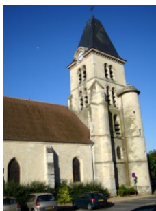
Eglise de Saint-Nom-la-Bretèche