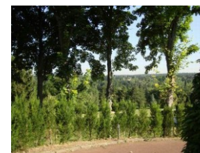
Vue sur le golf de St-Nom